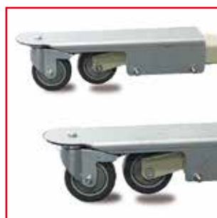
Optionale: adattatore per telaio 360° [ optional: chassis adapter 360° ]